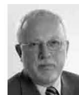
Lothar de Maizière

Herr de Maizière, der EAK bedankt sich bei Ihnen für das Gespräch.