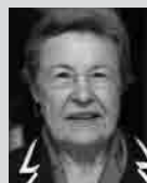
Prof. Dr. Dr. h.c. Ursula Lehr, Bundesministerin a.D.