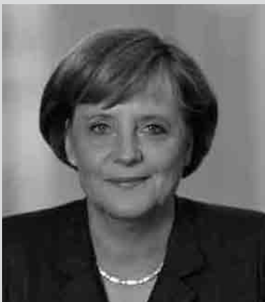
Bundeskanzlerin Dr. Angela Merkel MdB, Parteivorsitzende der CDU Deutschlands

Auf seiner 46. Bundestagung fragt der EAK nach der Zukunft unserer „älter werdenden“ Gesellschaft: Welche Chancen und neuen Möglichkeiten bietet der demographische Wandel unserer Gesellschaft? Wir laden Sie herzlich ein, mit uns Antworten auf diese wichtige Frage zu finden! Wir freuen uns, dass die folgenden Referentinnen und Referenten Ihre Teilnahme an der 46. Bundestagung des EAK bereits zugesagt haben: