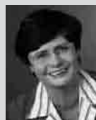
Christine Lieberknecht MdB, Ministerin für Soziales, Familie und Gesundheit des Freistaates Thüringen und stellvertretende Bundesvorsitzende des EAK der CDU/CSU