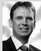
Dieter Althaus MdB, Ministerpräsident des Freistaates Thüringen