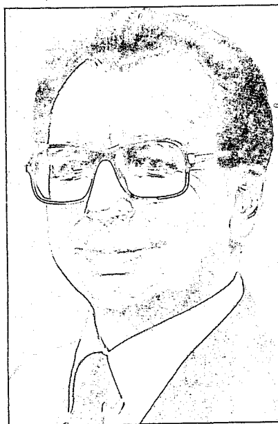
Ministerpräsident Dr. Lothar Späth

Jene Pfarrer, die ihre politische Meinungsbildung nicht – wie jeder andere auch – als Staatsbürger unter anderen Staatsbürgern treffen, sondern ihr politisches Engagement aus ihrem Amt ableiten, tun meiner Überzeugung nach weder dem Glauben und seiner Verkündigung, noch der Politik und dem politischen Handeln einen Dienst. Sicherlich: der Friede, das Leben sind höchste Güter, für den Christen in Gott selbst begründet und damit jedem unbedingt verpflichtend. Wie jedoch der Friede in der jeweiligen Situation am besten zu sichern sei, mit welchen Gesetzen der Staat das Leben schützen solle, das sind Fragen, auf welche Glauben und Theologie keine Antwort geben. Sie müssen je-