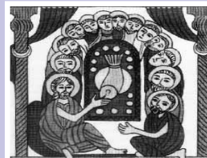
Armenische Kunstkachel

verstärkt der Bildung und Erziehung der Gemeinden zuzuwenden. 1528 und 1529 entstanden der Große und der Kleine Katechismus, die über Jahrhunderte Gegenstand kirchlichen Unterrichts bleiben werden. Auch ich habe im Konfirmandenunterricht noch die fünf Hauptstücke des Kleinen Katechismus auswendig lernen müssen. Das ist mir damals nicht leicht gefallen. Die Bedeutung mancher Textstücke ist mir oft erst Jahre später bewußt geworden. Wichtig geblieben ist mir die Erklärung zur Dritten Bitte im Vater-unser, die geprägt ist von Martin Luthers uner-