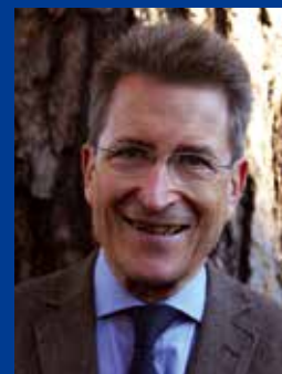
Altbischof Prof. Dr. Dr. h.c. Wolfgang Huber