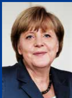
Bundeskanzlerin Dr. Angela Merkel