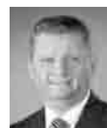
Hermann Gröbe MdB Generalsekretär der CDU Deutschlands

Erstveröffentlichung dieses Beitrags in „politik und kultur“ (Juli-August 2010).