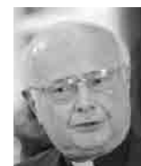
Dr. Robert Zollitsch Erzbischof des Erzbistums Freiburg und Vorsitzender der Deutschen Bischofs- konferenz

Grußwort gehalten am 12. Mai 2010 in München.