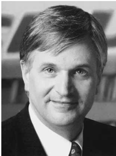
Peter Hintze: Politik auf die Gesellschaft von morgen ausrichten.

Das Zukunftsprogramm der CDU Deutschlands will Mut machen, Zuversicht wecken und Perspektiven für die bundesdeutsche Gesellschaft im 21. Jahrhundert aufzeigen. Es ist mit einem langem Atem geschrieben, welches unsere Bereitschaft unterstreicht, über die neue Legislaturperiode hinaus Verantwortung für Deutschland und Europa zu tragen. Angst vor der Zukunft ist ein schlechter Ratgeber und führt zu keinen konstruktiven Lösungen. Mit Mut, Optimismus und guter Hoffnung wollen wir christliche Demokraten die Zukunftsaufgaben in unserem Land anpacken. Dies tun wir auf der Grundlage