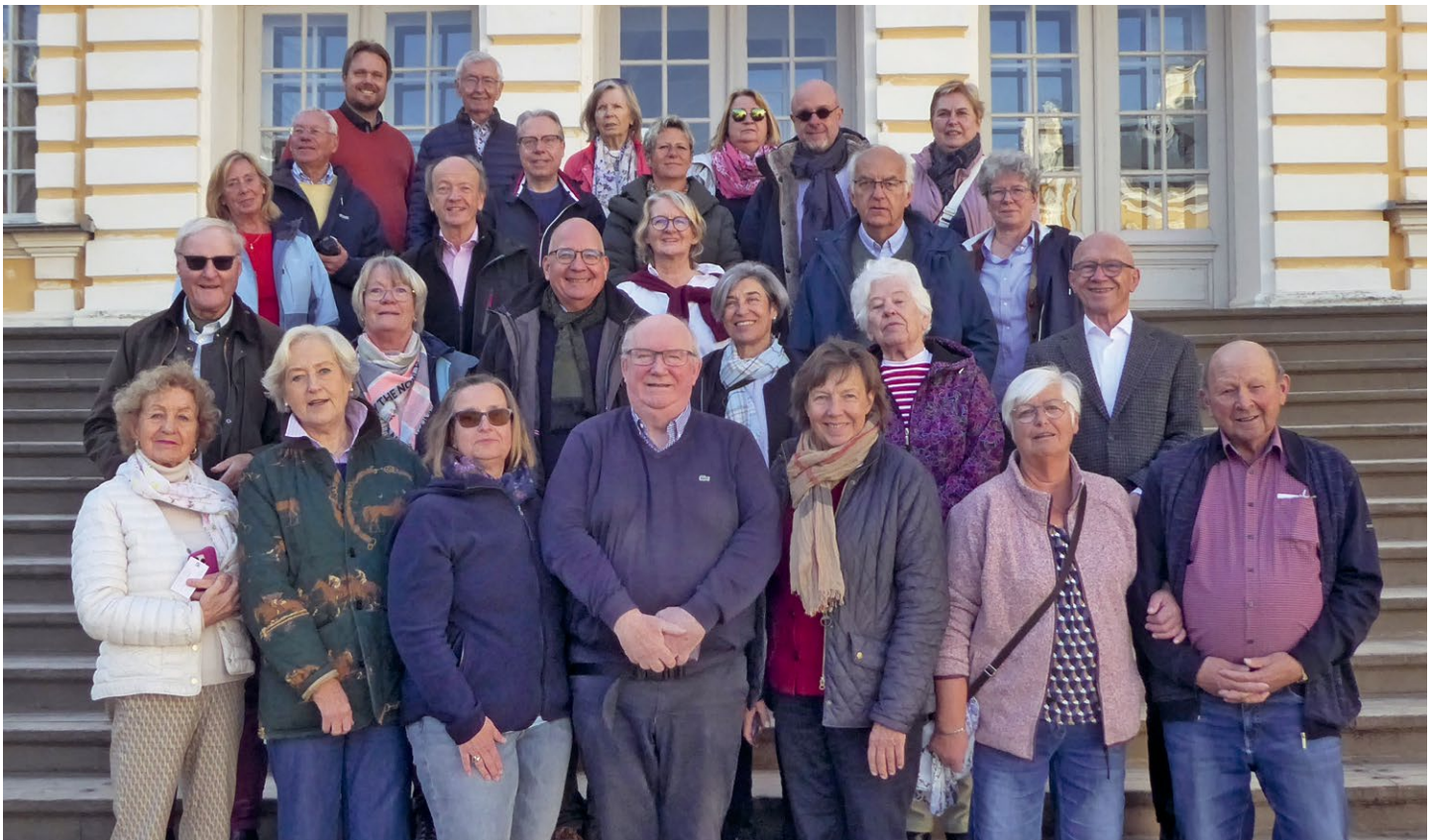
Die Reisegruppe vor dem Barockschloss Rundale in Lettland.